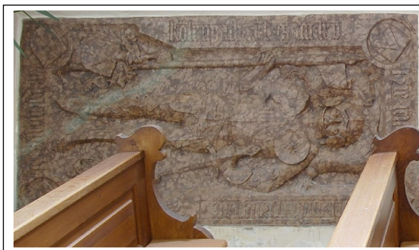
Liegendes Rotmarmor-Grabmal des Pangraz Hochholdinger d. Ä., im Eingangsbereich der Pfarrkirche von Pilsting.