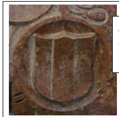
Das Fraunberger Wappen, auf dem Grabmal des Bernhard von Seyboltstorff - rechts unten.

Die Linie Fraunberg zu Fraunberg erhielt nach dem Erlöschen der Linie Fraunberg zu Haag von Kaiser Maximilian II. im Jahr 1570 die Genehmigung zur Vermehrung ihres Wappens mit dem der ausgestorbenen Grafen von Haag.