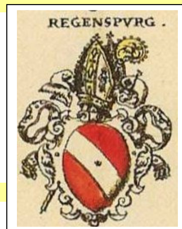
Das Wappen des Hochstiftes Regensburg mit Mitra und Bischofsstab

Bischof Rupert II. von Regensburg, der Sohn des Pfalzgrafen Friedrich von Sponheim, hat ihn in der St. Emmeramskirche begraben.