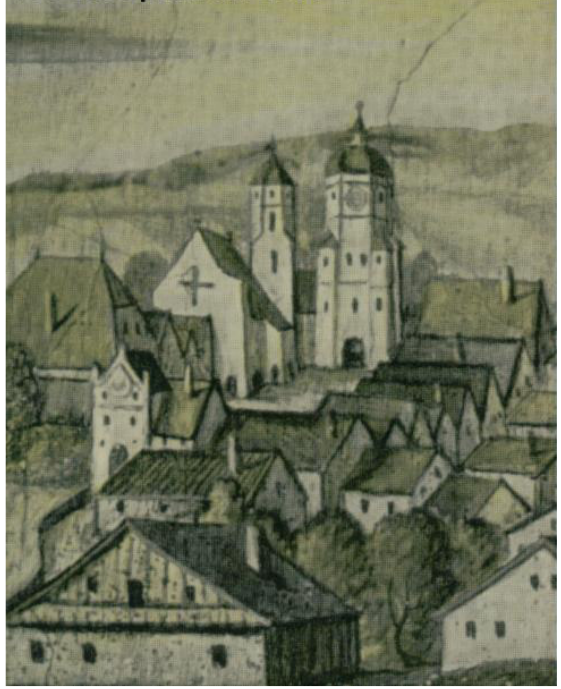
Tor mit Spital um 1580

Links vom Vilsbiburger Stadtturm ist das Spital mit der angebauten Spitalkirche mit Glockenturm, die Katharinenkapelle. (Auszug aus dem Fresco des Hans Donauer um 1580, im Antiquarium der Münchner Residenz).